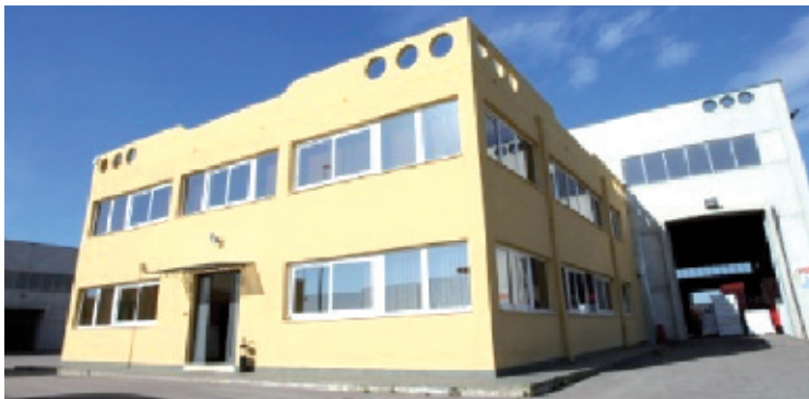
Sede produttiva della Tema Sistemi