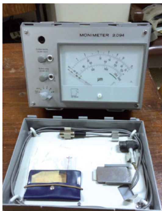
Figura 1 - Strumento ad ultrasuoni

La Norma [7] è scritta per vernici di nuova applicazione e quindi può fornire indicazioni su condizioni ambientali, di posa in opera e