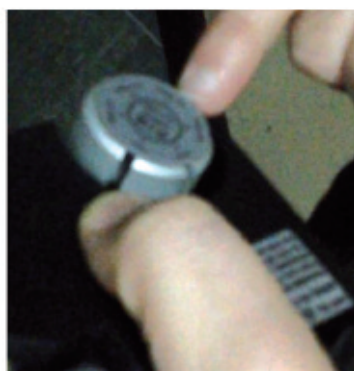
Figura 2 - Strumento ottico