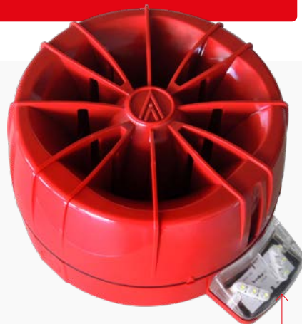
La nuova sirena da interno/esterno TFIES03

Tecnofire è compatibile con tutte le centrali Tecnofire tramite il nuovo gateway TF CLOUD, con connessione ethernet o 4G.