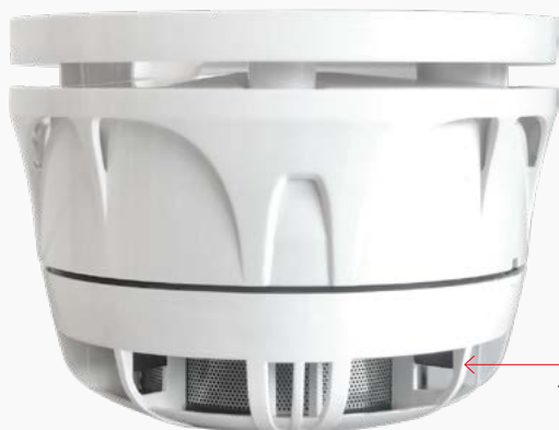
TFBASE-SIREN nella sua nuova versione

Vi aspettiamo dal vivo per scoprire queste e altre novità in anteprima. Rinnoviamo l'appuntamento per il 15-16-17 novembre a Rho Fiera Milano , ricordandovi la posizione del nostro stand: Padiglione 7P – Stand K11 K19 M12 M20