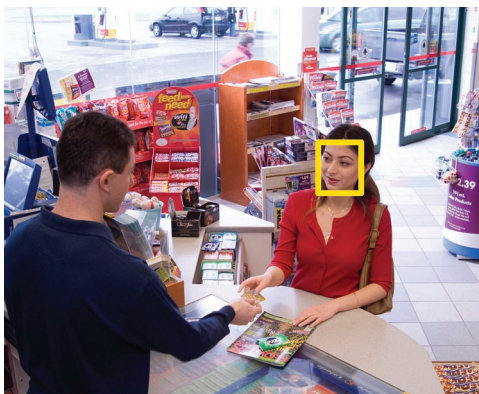
Rilevamento del Volto