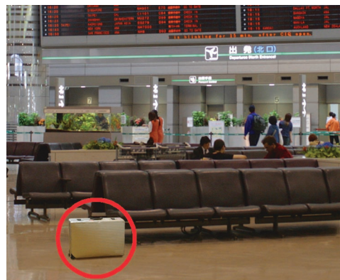
Riconoscimento Oggetti Incustoditi