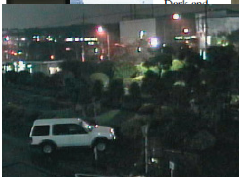
Conventional Details are unclear. Conventional