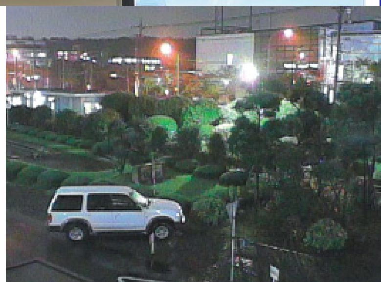
i-Pro The entire screen is clear. Can be seen both indoors and outdoors.